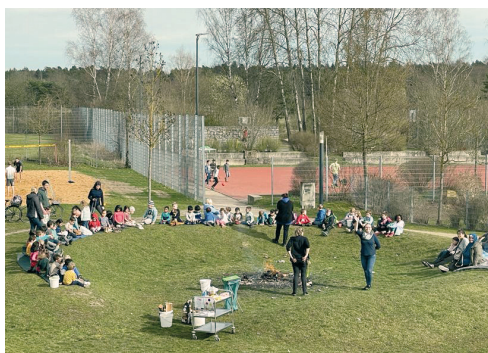
Jedes Jahr organisieren wir ein Kartoffelfeuer. Ihr seid herzlich eingeladen.