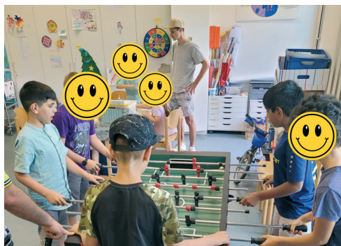
Kickerturniere mit Siegerehrung! Kommt einfach Vorbei!